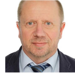
Kari Halonen Toolbox Consulting Oy