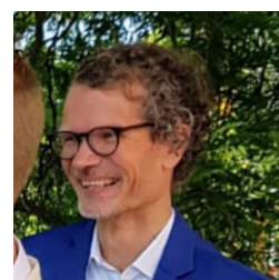
Marko Venjö Travel and Stay