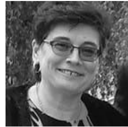
Arja Kortesuoma Asiantuntijapalvelut Korpur Oy